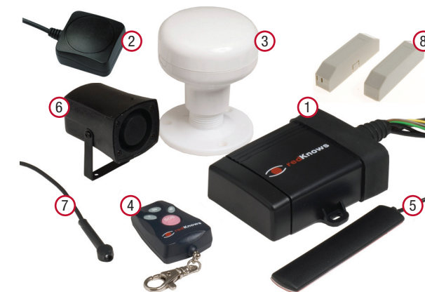
Komponenter SBX-3 Mini Tracker Marine och Vehicle.

Det finns två paket av redKnows SBX-3 att välja mellan: "Marine" och "Vehicle". Det som skiljer dem åt är framförallt typen av GPS-antenn. Det marina paketet har en vädertålig antenn för utomhusbruk, medan Vehicle paketet har en mindre GPS-antenn som bör placeras inomhus. I Marinpaketet ingår även magnetbrytare.